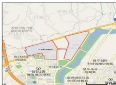
광주광역시 북구 첨단산업단지 일원