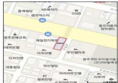
광주광역시 북구 무등로 190