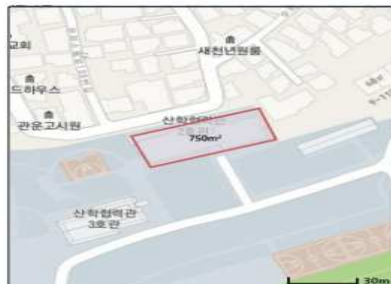
광주광역시 북구 용봉로 77, 전남대학교 산학협력2호관