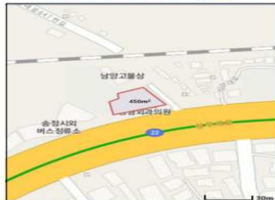
광주광역시 광산구 상무대로 287