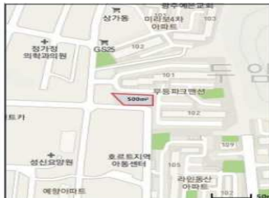
광주광역시 북구 월동로 28