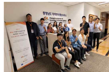
<수출상담회 및 현지 유관기관 방문 활동사진>