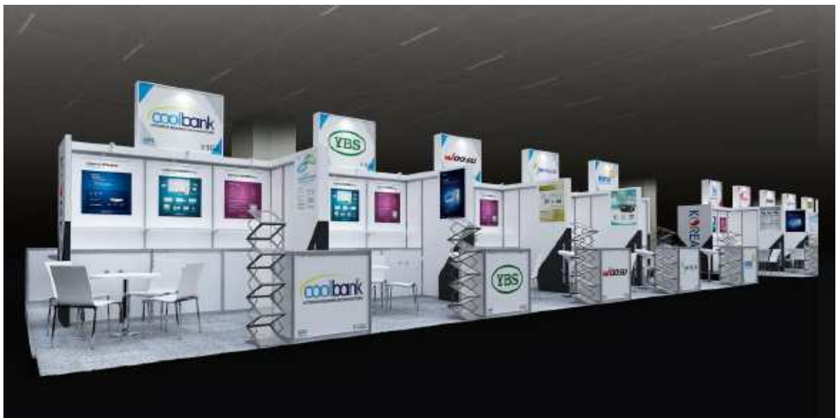
<충남관 단체부스 구성 예상도>