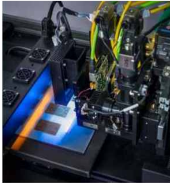
【PCB 제작용 3D 프린터 기본 사양】