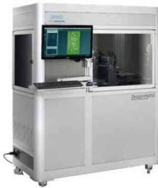
【PCB 제작용 3D 프린터】