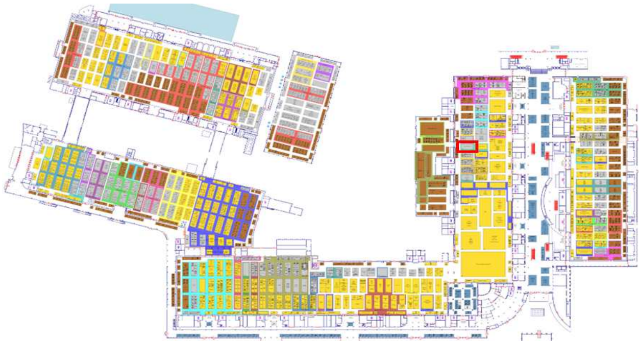
[그림] Arab Health 2024 도면