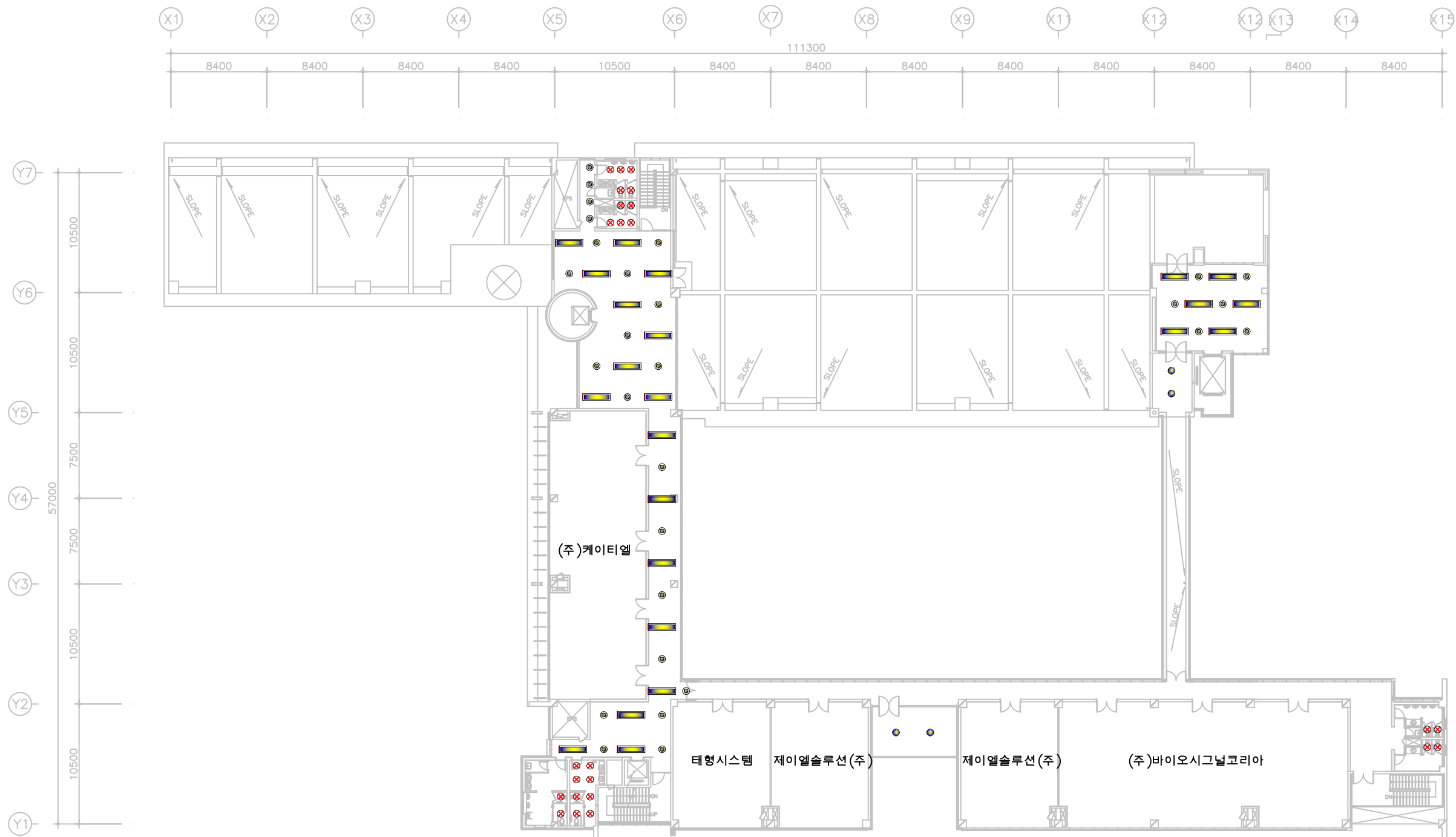
지상 4층 평면도