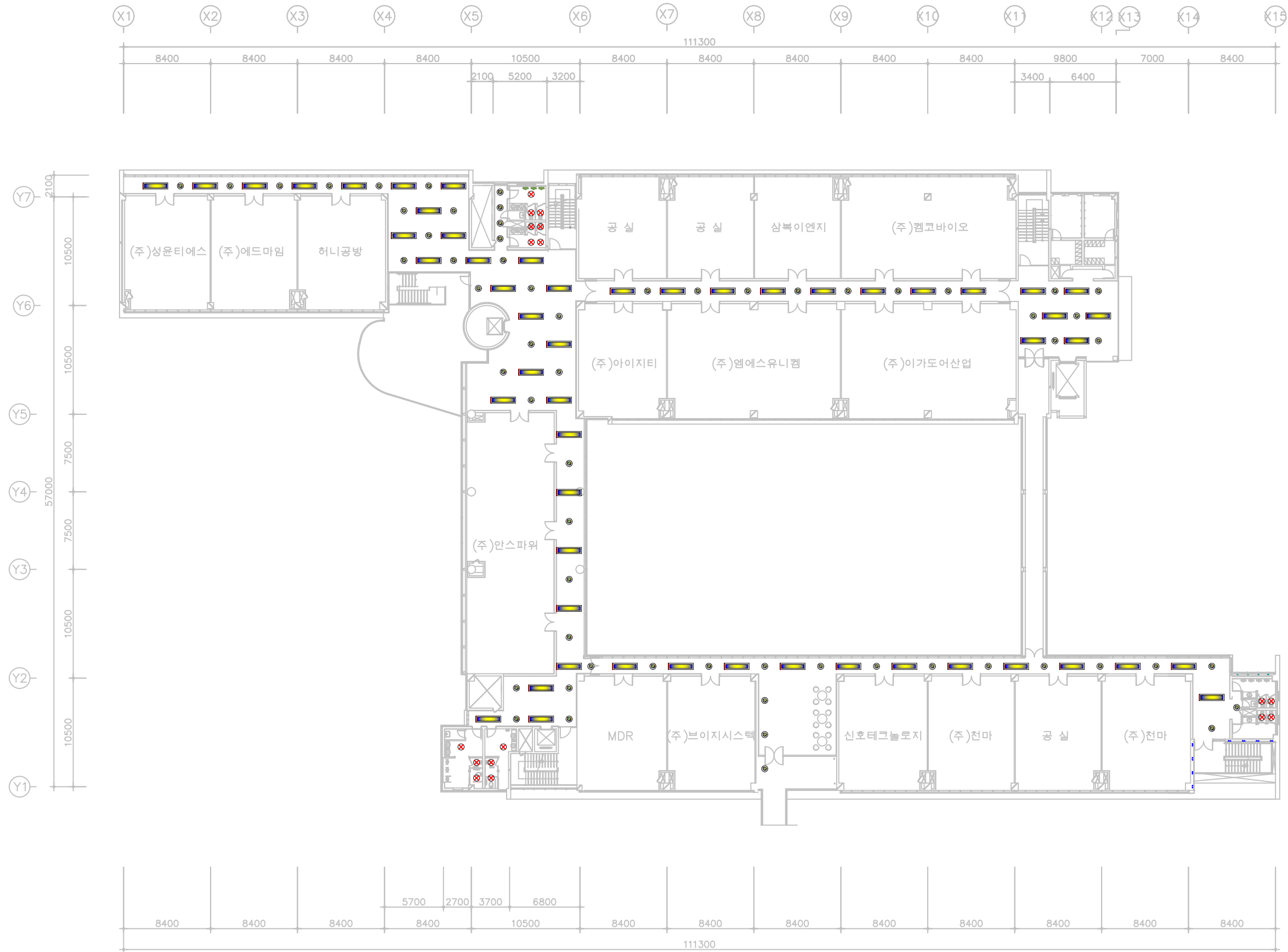
지상 2층 평면도