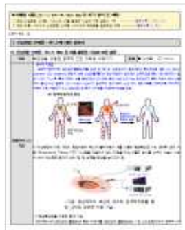
<규제발굴 관련 산업융합 신제품 서비스 설명서 예시>