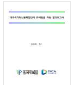
<규제발굴 결과보고서 예시>