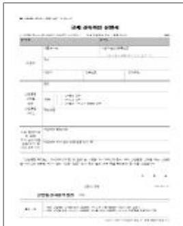
&lt;규제신속확인 신청서 예시&gt;