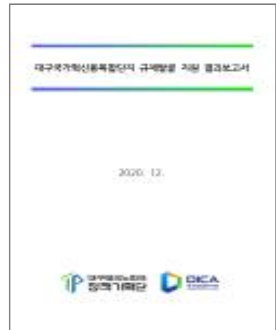
&lt;규제발굴 결과보고서 예시&gt;