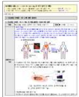
&lt;규제발굴 관련 산업융합 신제품·서비스 설명서 예시&gt;