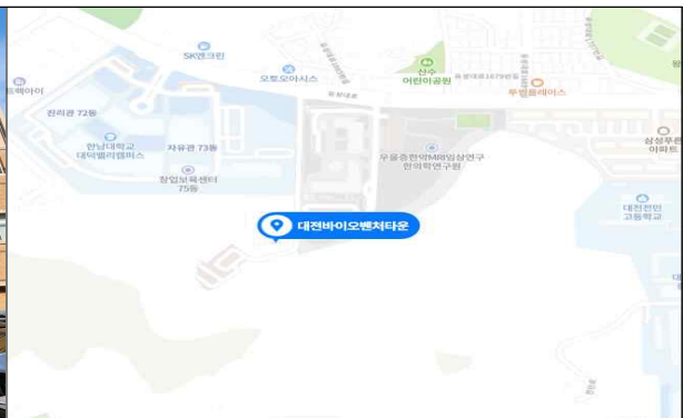
대전광역시 유성구 유성대로 1662(전민동) 대전바이오벤처타운