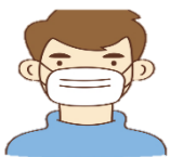
마스크 쓰기 서로 조심하기