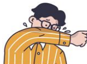
기침이나 재채기할 때 옷소매로 입과 코 가리기