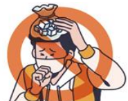
발열, 호흡기 증상자와의 접촉 피하기