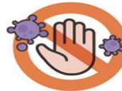
씻지 않은 손으로 눈·코·입 만지지 않기